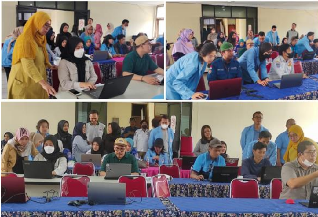
Gambar 1. Foto Kegiatan Pengabdian Masyarakat pada Karang Taruna RW 05

dengan arahan tutor. Pesertapun diberikan kesempatan untuk mengajukan pertanyaan yang selanjutnya dijawab dan dijelaskan oleh tutor sampai dengan peserta memahaminya.