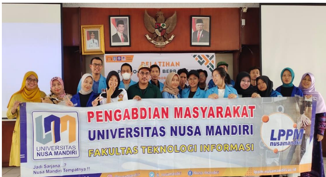
Gambar 2. Foto Bersama Pendamping dan Peserta PkM pada Karang Taruna RW 05

Berikut merupakan desain website yang telah dibuat oleh Karang Taruna RW 05, hasil dari pelatihan pembuatan desain website sebagai berikut: