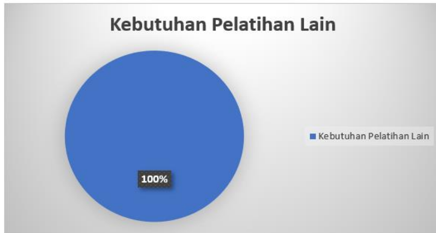
Gambar 6. Hasil Evaluasi Kebutuhan Pelatihan Lain