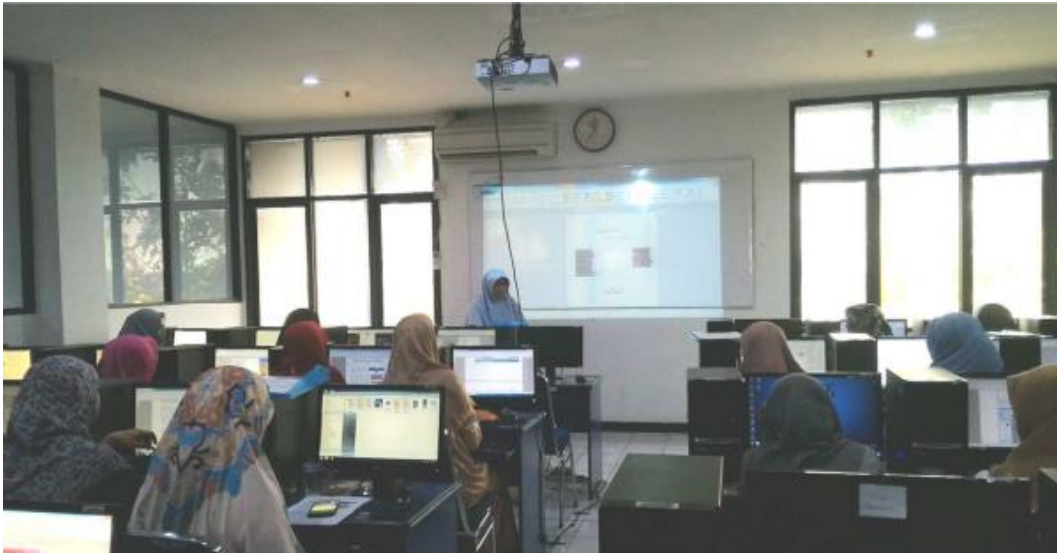
Gambar 2: Pelatihan di Laboratorium Komputer

disampaikan secara langsung di komputer laboratorium. Dengan cara ini mereka merasa lebih mampu untuk meneliti dan memahami detail subjek.