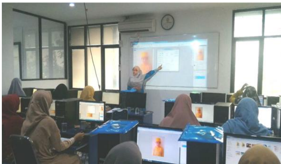
Gambar 3: Sesi Tanya Jawab

Berdasarkan aktivitas peserta pada forum pelatihan terlihat bahwa reaksi peserta sangat tinggi. Banyak dari mereka yang bertanya, kemudian ikut berdiskusi, lalu melanjutkan praktik materi yang ditanyakan. Sebagian besar tanggapan antusias datang dari peserta yang mengetahuinya tetapi belum menyelesaikannya atau masih ragu. Forum pelatihan ini berfungsi sebagai media untuk mengajukan pertanyaan terperinci. Pada saat yang sama, peserta yang sama sekali tidak mengetahui aplikasi ini atau yang tidak pernah menggunakannya cenderung tidak aktif. Reaksi yang mereka berikan sangat sedikit. Mereka biasanya tampak malu untuk bertanya. Namun, ketika instruktur mendekati mereka dan menanyakan kesulitan, mereka lebih terbuka dan siap mengungkapkan keinginan mereka untuk bisa dibantu dalam mempraktekkan materi.