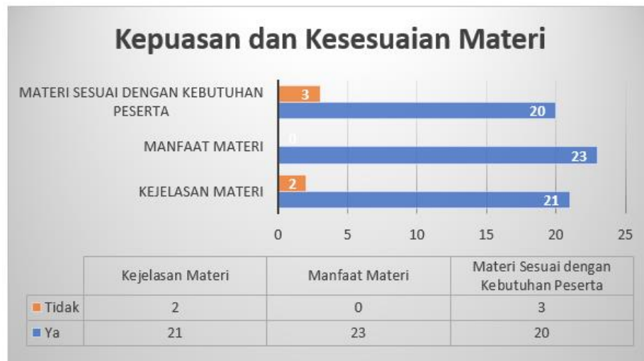
Gambar 4: Hasil Evaluasi Kepuasan dan Kesesuaian Materi

Hasil penilaian pada bagian kepuasan dan kesesuaian materi pada gambar 4, dapat diketahui bahwa untuk kejelasan materi yang disampaikan pengajar bernilai 91,3 %. Manfaat pelatihan bernilai 100% dan kesesuaian materi dengan kebutuhan peserta yaitu 87%.